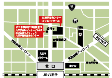
JR八王子駅北口より徒歩4分/京王八王子駅より徒歩4分